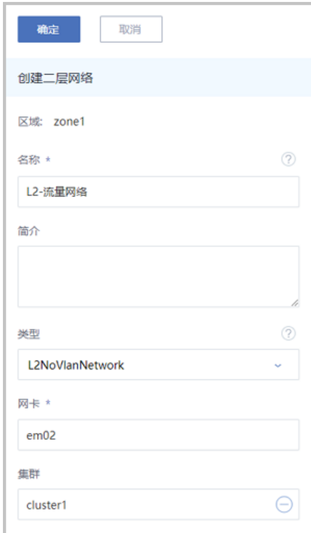
图 2: 创建L2-流量网络