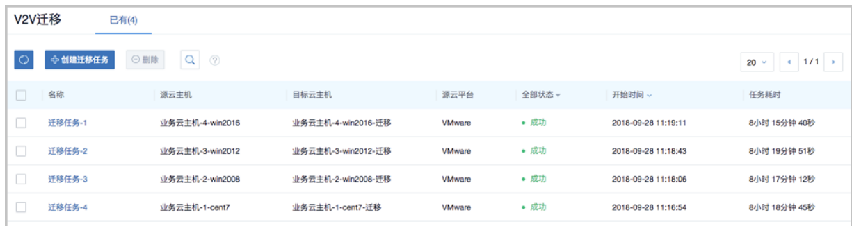
图 2: V2V迁移

ZStack 3.0.1新增支持V2V迁移服务，可将已接管的vCenter云主机迁移至ZStack云平台。V2V迁移服务以单独的功能模块形式提供给用户。如图 2: V2V迁移所示：